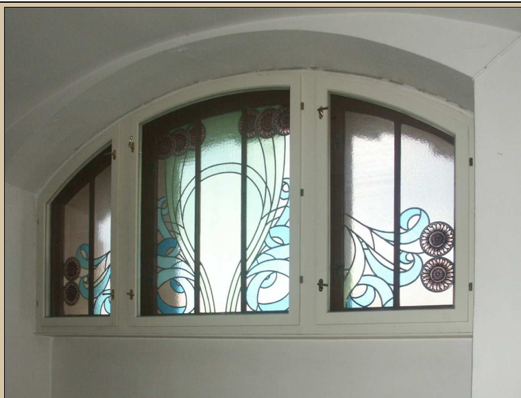
celkový pohled z interiéru

Po dokončení opravy rámu nechat restaurátorem zkontrolovat vitráž.