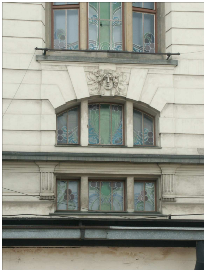
celkový pohled z exteriéru