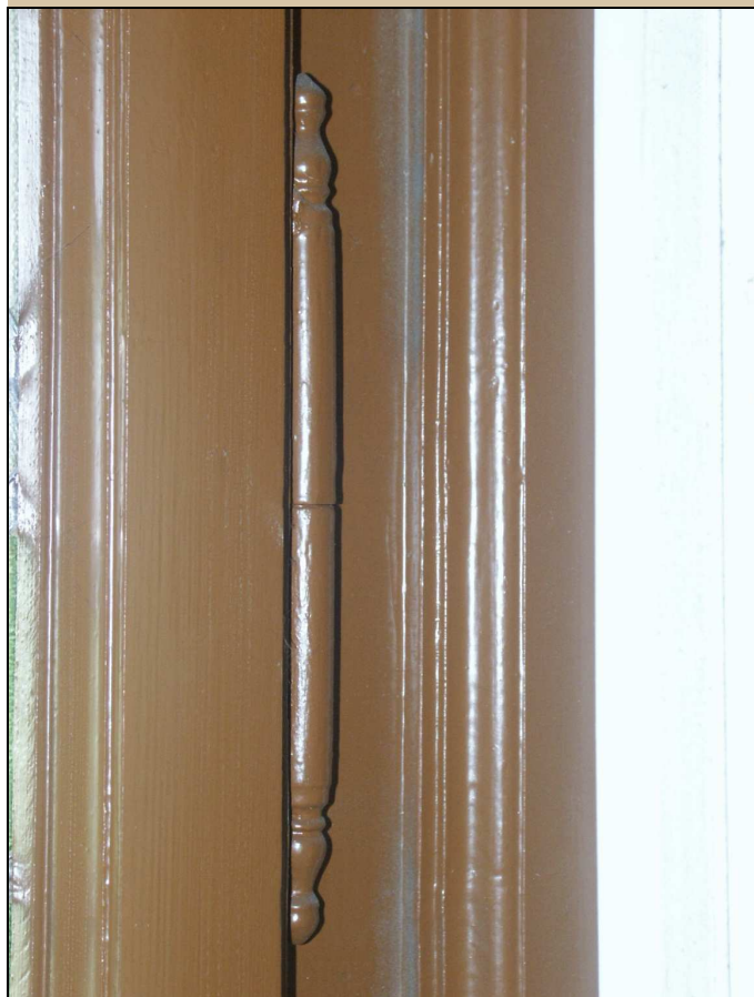
zapuštěný okenní závěs